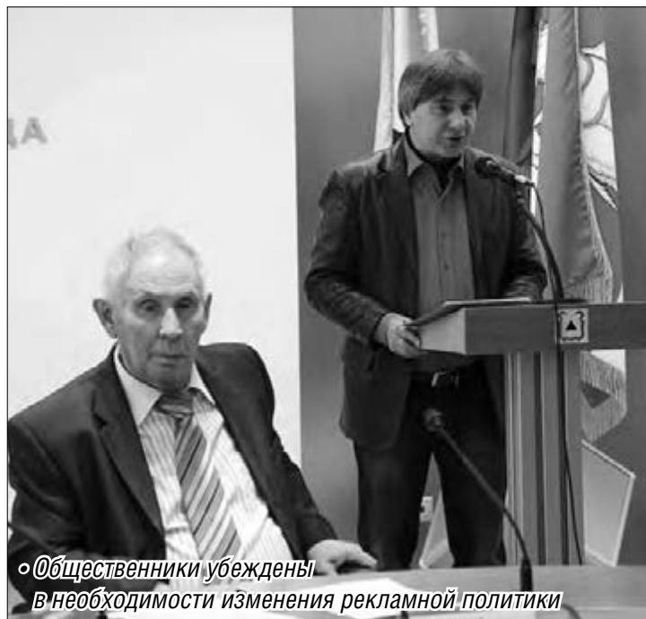
«Общественники убеждены в необходимости изменения рекламной политики»

Безусловно, есть в этой ситуации и морально-нравственная составляющая, а именно содер-