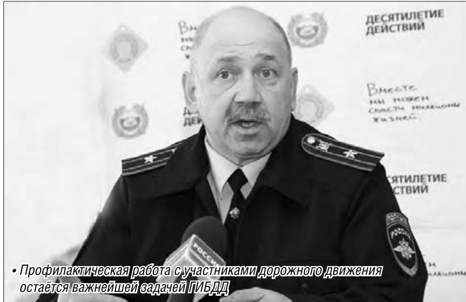
• Профилактическая работа с участниками дорожного движения остаётся важнейшей задачей ГИБДД

Возвращаясь к квартальной статистике, обозначим, что наиболее распространенными нарушениями при ДТП со стороны водителей стали нарушение правил проез-