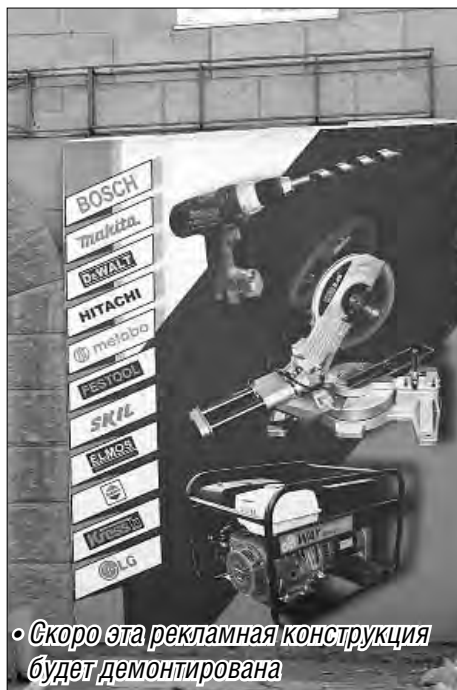
«Скоро эта рекламная конструкция будет демонтирована»

Совершенно очевидна необходимость эффективного сопротивления этому рекламному терроризму. Общественники не сомневаются: давно пора кончать с агрессивной безвкусицей, уродующей облик города. Но... Как именно? Легко сказать «пора»! А если ближе к делу, то сразу выясняется, что «законодательные рудуть» для сопротивления рекламной экспансии в современном Отечестве слабоваты. Соответствующая нормативная база невнятна и рыхла. Она уязвима тем, что почти