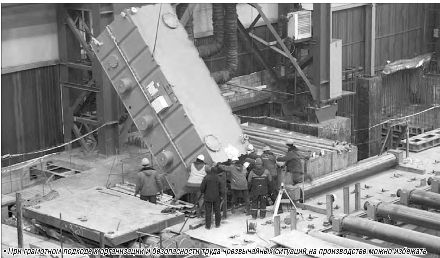
• При грамотном подходе к организации и безопасности труда чрезвычайных ситуаций на производстве можно избежать

Охрана труда и соблюдение прав работников всегда актуальны